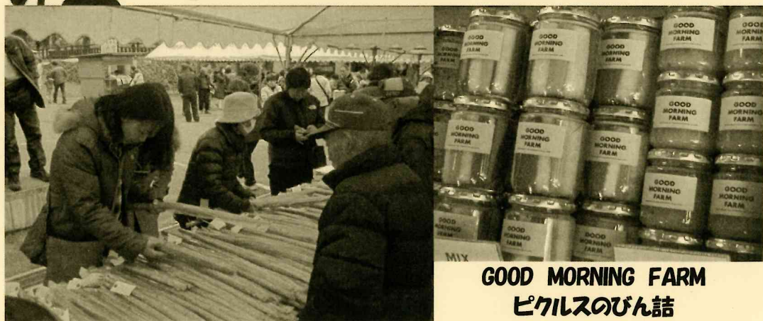
GOOD MORNING FARM ピクルスのびん詰