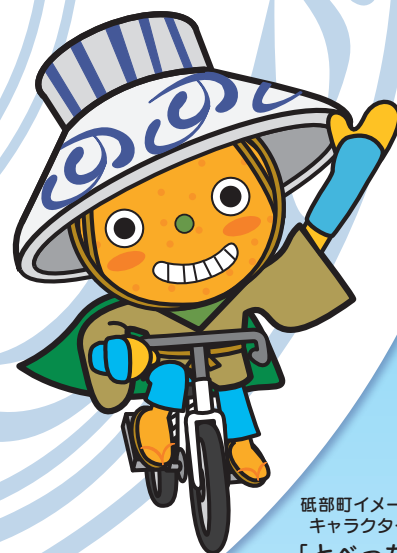
砥部町イメージ キャラクター 「とべっち」

砥部町内をサイクリングしながら、チェックポイントを回りましょう。 4カ所以上のチェックポイントを回ると、自転車や砥部町の特産品が当たる抽選に応募できます。 チェックポイントでは、砥部焼の絵付け体験もできます!